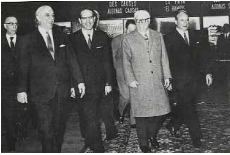
Il Presidente della Repubblica on. Giovanni Gronchi entra nel palazzo della FAO per assistere alla seduta inaugurale del Congresso (1962).