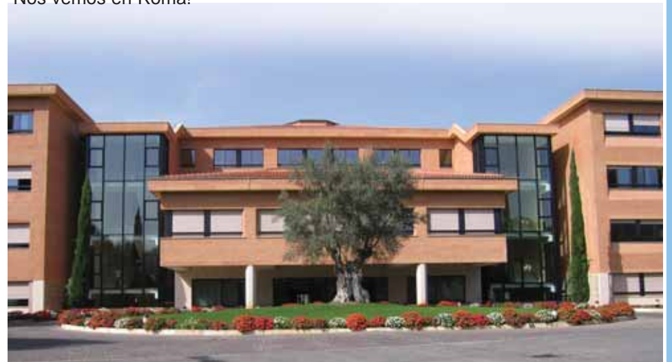
Università Europea di Roma